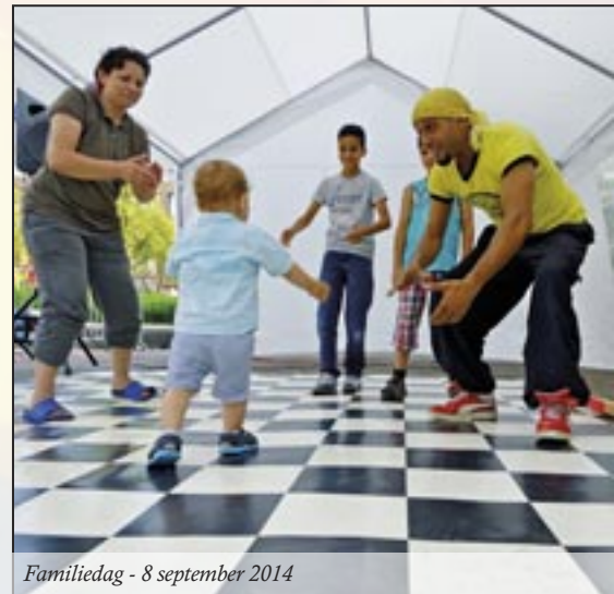
Familiedag - 8 september 2014