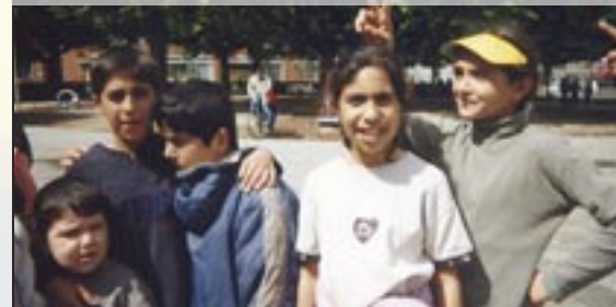
Nationale straatspeeldag - 29 mei 2002

Twee jaar later werd de container overgedragen aan de Stichting.