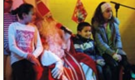
Sinterklaas - 3 december 2014