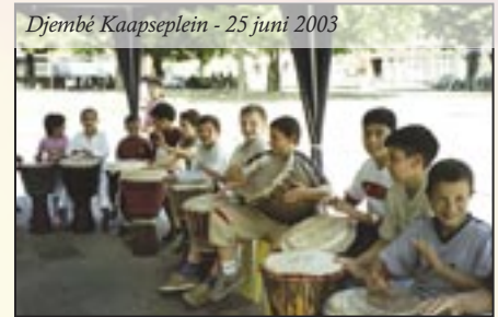
Djembé Kaapselein - 25 juni 2003