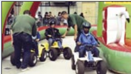
Zomerfeest - 2 juli 2003