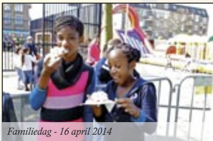
Familiedag - 16 april 2014