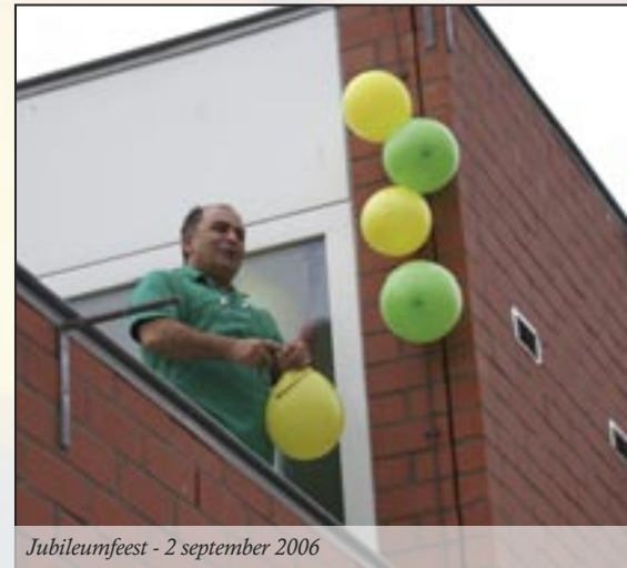
Jubileumfeest - 2 september 2006