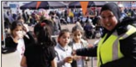
Koningsdag - 27 april 2017