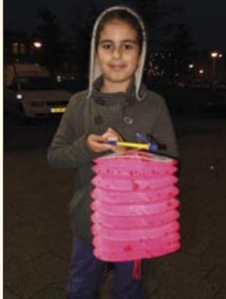
11e Lampionnenoptocht - 3 november 2010