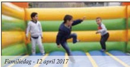
Familiedag - 12 april 2017