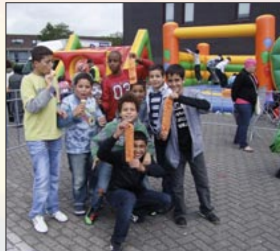
Familiedag - 10 september 2010