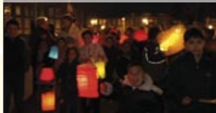
Lampionnenoptocht - 17 november 2005