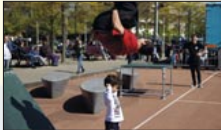
Wijkpark Sportmaatjes - 10 mei 2017