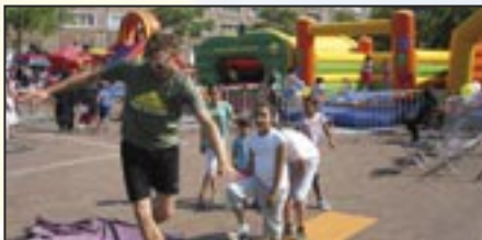
Sportworkshop Stellenboschplein - 31 aug. 2016