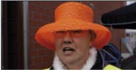
Koningsdag - 27 april 2017