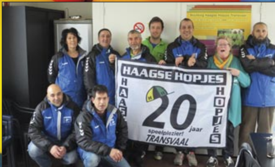
Medewerkers Haagse Hopjes - 16 februari 2017