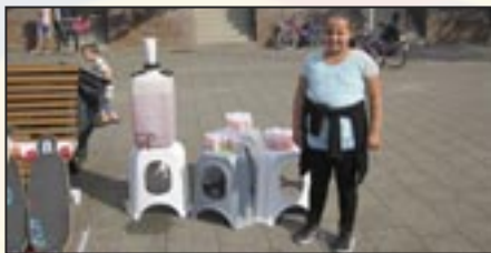
Familiedag - 31 augustus 2016