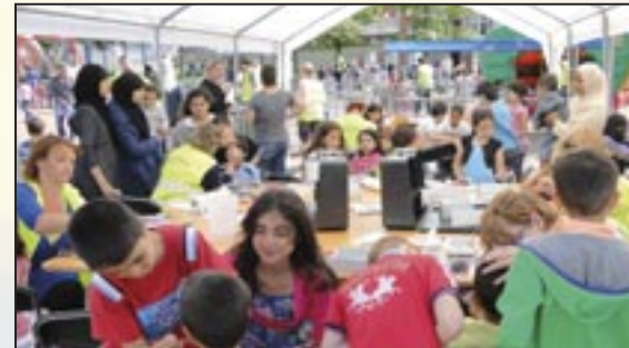
Kingdag op het Wijkpark Transvaal - 30 juni 2011