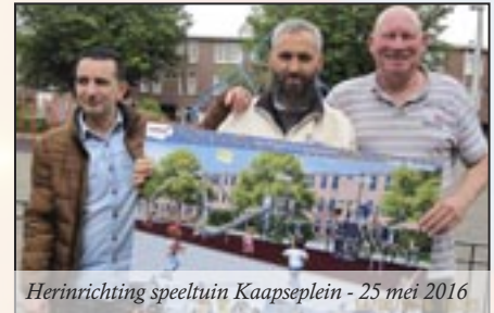
Herinrichting speeltuin Kaapselein - 25 mei 2016