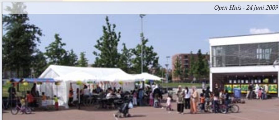
Open Huis - 24 juni 2009