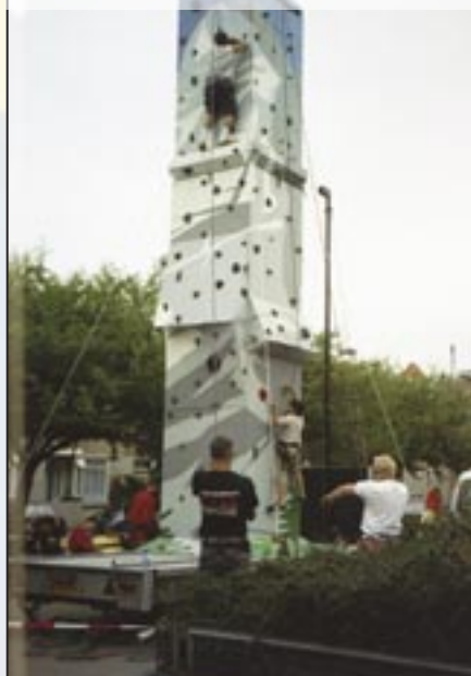
Ruth Firstplein, klimmuur - 11 augustus 2003