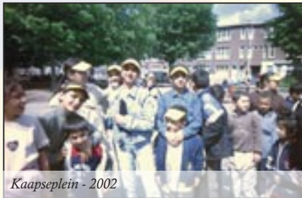
Kaapselein - 2002