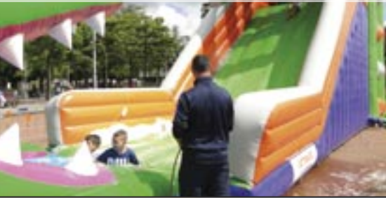
Wijkpark Vakantieactiviteit - 5 augustus 2016