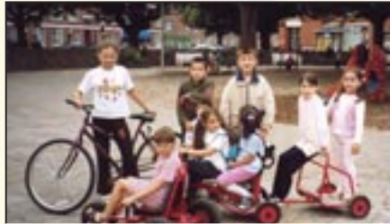
Nieuw speelgoed - september 2002