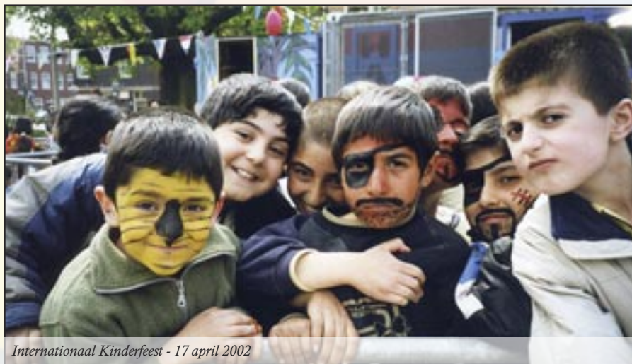
Internationaal Kinderfeest - 17 april 2002

De opening van het 1ste Haagse Hopje was op 8 mei 1996.