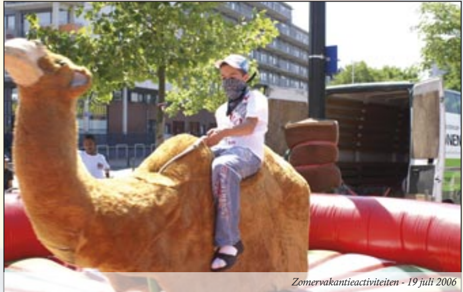
Zomervakantieactiviteiten - 19 juli 2006

Deze Hopmobiel werd na een lange voorbereiding op 21 februari 2003, gebracht op het Anna Blamanplein. Natuurlijk werd vlak daarna het eerste feestje gehouden op 26 februari 2003. 26 juni 2007 kreeg het Anna Blamanplein de gerenoveerde container van het Wijkpark Transvaal en deze werd op 11 juli 2007 feestelijk geopend met de eerste familiedag op het Anna Blamanplein.