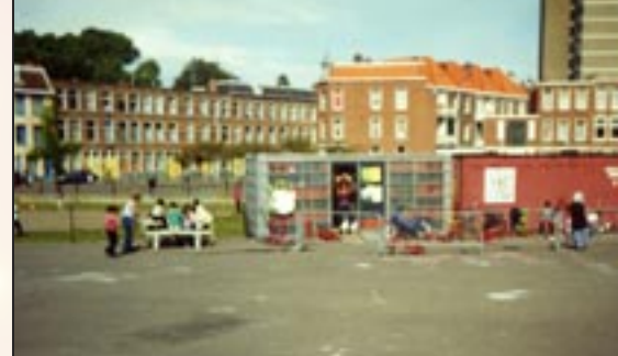
Internationaal kinderfeest - zomer 2000