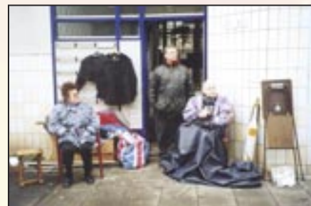
Koninginnedag - 30 april 2002