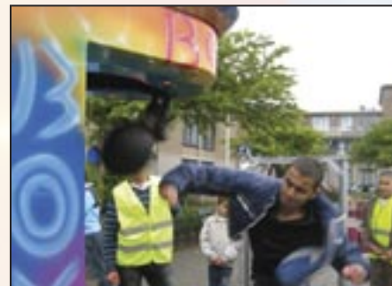
Nationale Straatspeeldag - 10 juni 2009