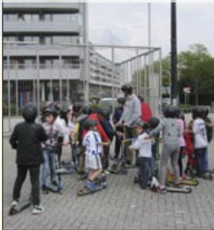
Sportworkshop - 17 mei 2016