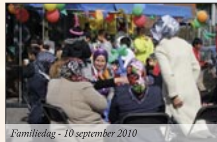
Familiedag - 10 september 2010