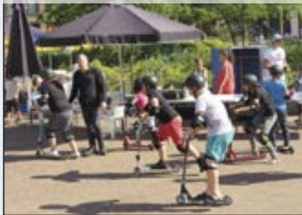
Sportworkshop - 5 juli 2017