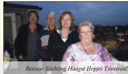
Bestuur Stichting Haagse Hopjes Transvaal

Stichting Haagse Hopjes Transvaal Wijkpark Transvaal, Wolmaransstraat 10, 2572 EK Den Haag Mob. 06 - 307 21 668 E-mail: info@haagsehopjes.nl