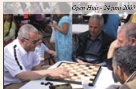
Open Huis - 24 juni 2009