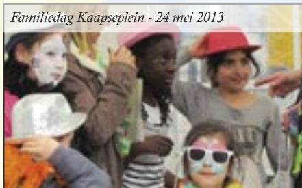
Familiedag Kaapselein - 24 mei 2013