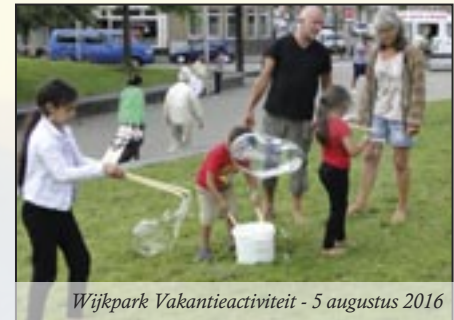
Wijkpark Vakantieactiviteit - 5 augustus 2016