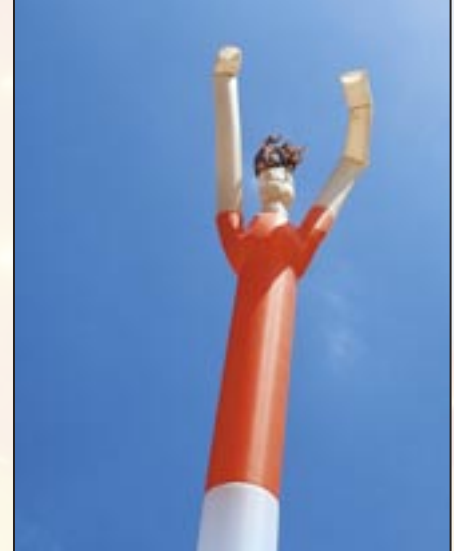
Opening Wijkpark Transvaal - 18 juni 2005