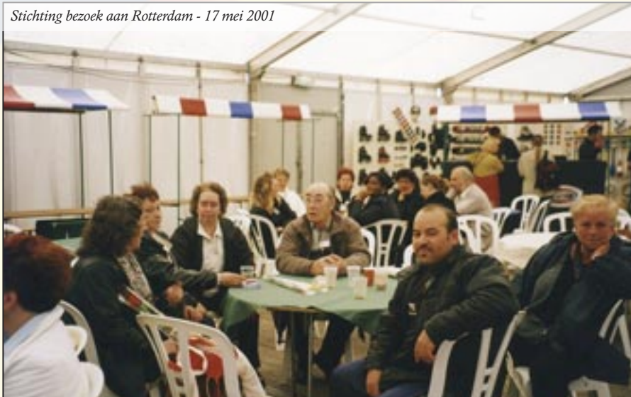
Stichting bezoek aan Rotterdam - 17 mei 2001

Ook bleek in Rotterdam, dat jongere en oudere kinderen beter met elkaar omgingen op het plein/park. De komst van de spelcontainers op de pleinen zorgden er voor, dat er dagelijks 150 tot 200, met mooi weer zelfs