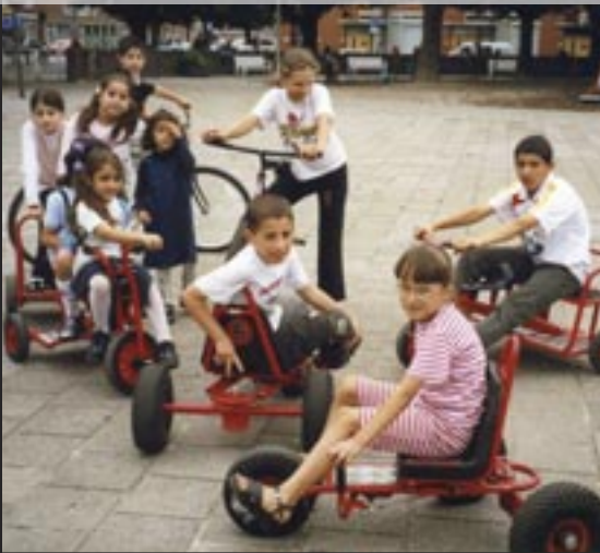
Nieuw speelgoed van sponsor Madurodam - augustus 2002

Wij boften toen met de medewerkers die een baan hadden gekregen via een Melkertbaanregeling”.