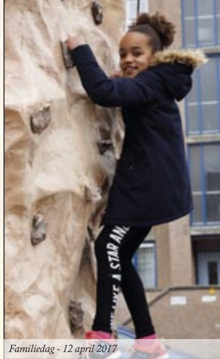
Familiedag - 12 april 2017