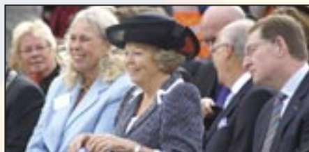
Opening Sprankelplek A. Blamanplein van Jantje Beton door Koningin Beatrix - 21 oktober 2006