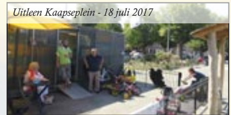
Uitleen Kaapselein - 18 juli 2017