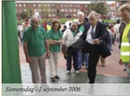
Siemensdag - 2 september 2006