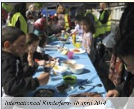
Internationaal Kinderfeest- 16 april 2014