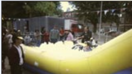
Straatspeeldag Kaapselein - 29 mei 2002